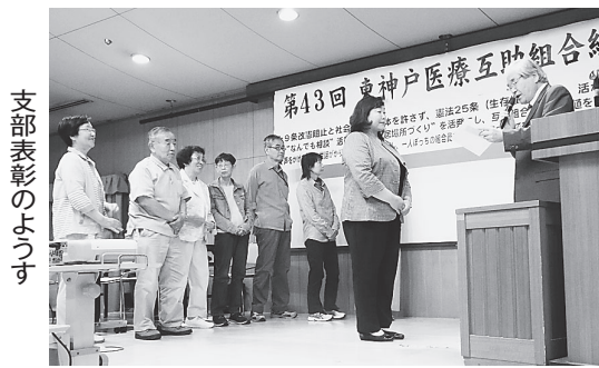
支部表彰のようす

さらに、フロアから7つの報告があり、兵庫支部からは、「つなばやしサロン」開設1年間の取り組みの成果。ほか支部からは、多彩な班会の経験。うはら支部からは、コープ店舗での健康チェックが定着してきた実践。灘東支部からは、診療所がなくなっても居場所「ほおずき」を中心に利用委員会を立ち上げ取り組む実践報告と10年目を迎えた鶴甲班の活動経験。北支部からは、大腸がんチェック運動を大きく広げてきた実践。そして、居場所「野の花サロン」で毎月開催されている「どんぐり昼食会」からは、ひとりぼっちをつくらないを合言葉に始まり、ついに200回を迎えた歴史と活動の実践などが報告され、他の総代からは「もつと発言したかった」との声も寄せられました。