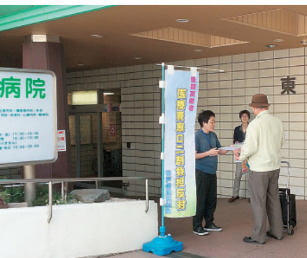
5月22日 毎日コソコソと病院玄関前で署名活動しています

本年度の組織委員会の大きな活動として、互助組合の組織実体の改善をやり遂げようと考えています。加入申込書の改善や『健康ニュース』配達報告書での迅速な実体把握、出資金と名義変更のルール確認など、多くの課題克服のためにとりくみを強化したいと考えています。まずはプロジェクトチームの編成と専門家のアドバイザーを取り入れ、改善に向けてとりくみを進めていきたいと思ひます。