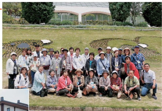
5月19日 ほくら支部が淡路へバス旅行